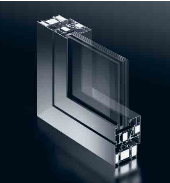
Schüco Fenster AWS 70 FR 30 Vertikalschnitt Schüco Window AWS 70 FR 30 Vertical section detail